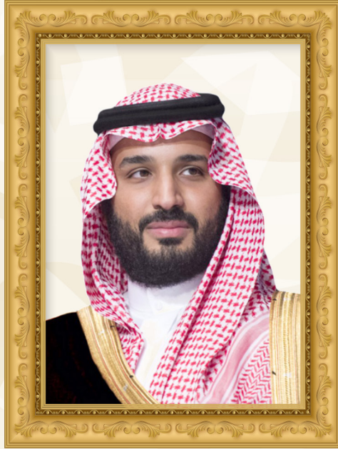
الأمير محمد بن سلمان بن عبدالعزيز آل سعود