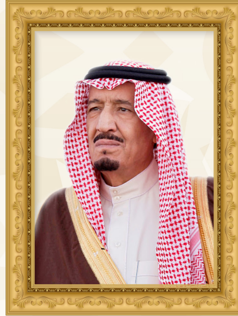
الملك عبد الله بن عبدالعزيز آل سعود