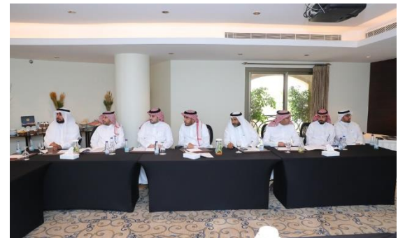
جانب من ملتقى الفصول الثلاثة