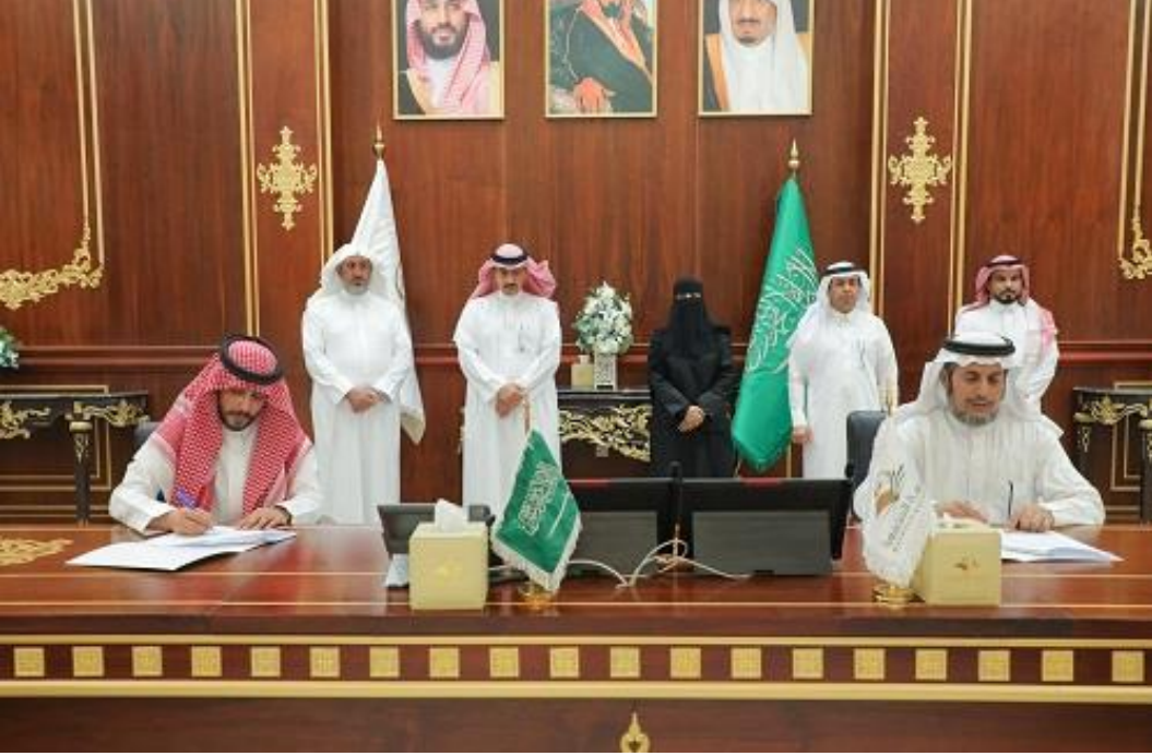
رئيس الجامعة أ.د. المزعل خلال رعايته مراسم توقيع الاتفاقيات

صادر من "وحدة العلاقات والتوثيق" بوكالة الجامعة للشؤون التعليمية