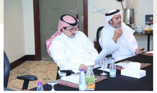
رئيس الجامعة أ.د. المزعل