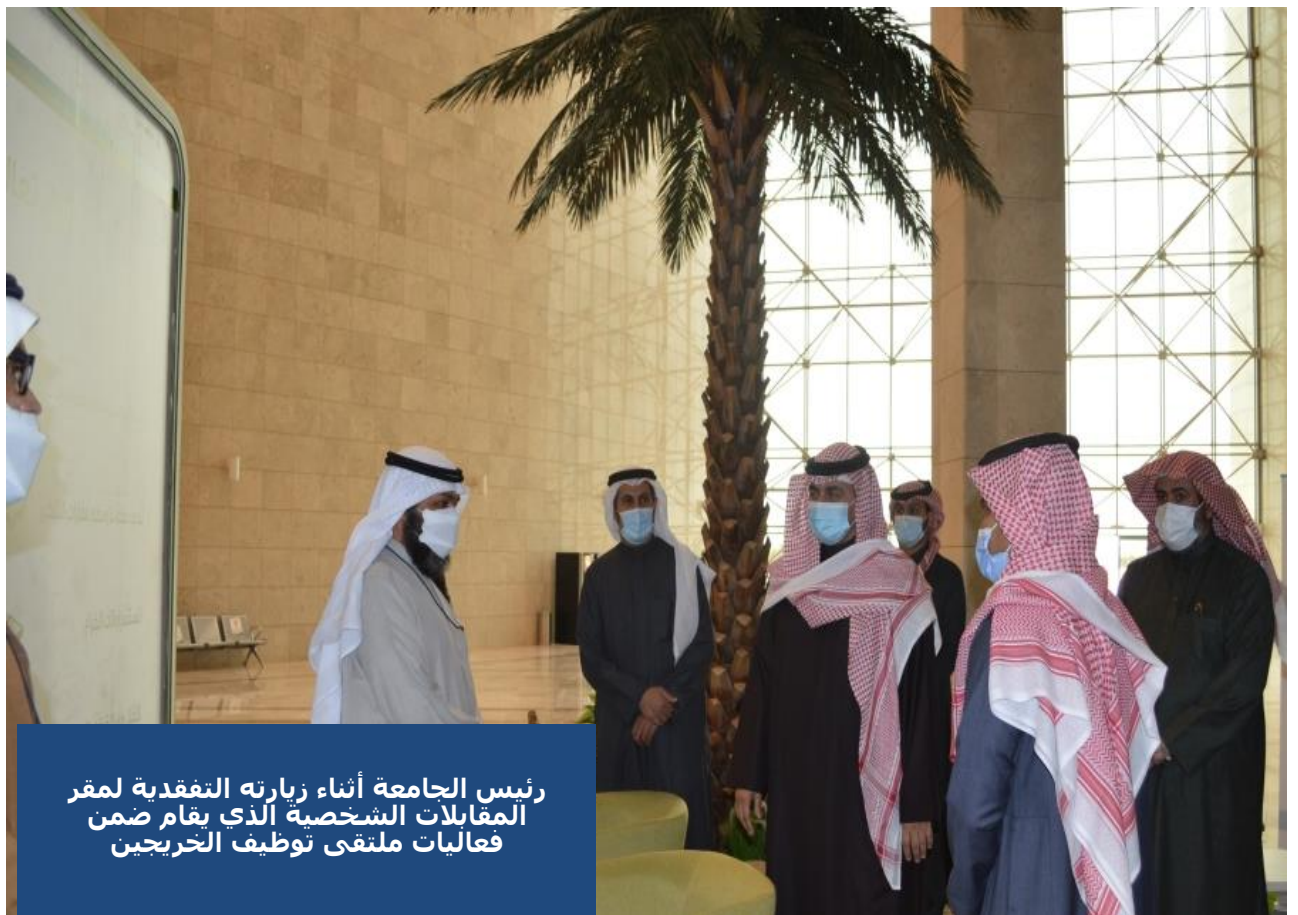
رئيس الجامعة أثناء زيارته التفقدية لمقر المقابلات الشخصية الذي يقام ضمن فعاليات ملتقى توظيف الخريجين

هذا وتأتي سلسلة هذه الاجتماعات ضمن أعمال لجنة الخطط والنظام الدراسي في إطار الجهود المبذولة لتنفيذ خارطة الطريق التفصيلية لإجراءات التحول إلى نظام الفصول الدراسية الثلاثة في الجامعة، وذلك بتوجيه وإشراف مباشر من سعادة رئيس الجامعة الأستاذ الدكتور صالح بن عبدالله المزعل.